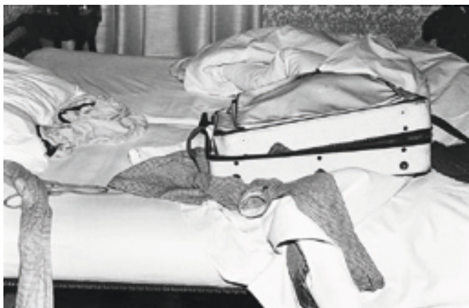
Sophie Calle, Chambre 43. 28 février / 3 mars (détail), 1983. Photographie. Courtesy Galerie Emmanuel Perrotin, Paris. © Sophie Calle.

Dans le cadre de l'exposition everyday(s) au Casino Luxembourg (30/01/10 – 11/04/10).