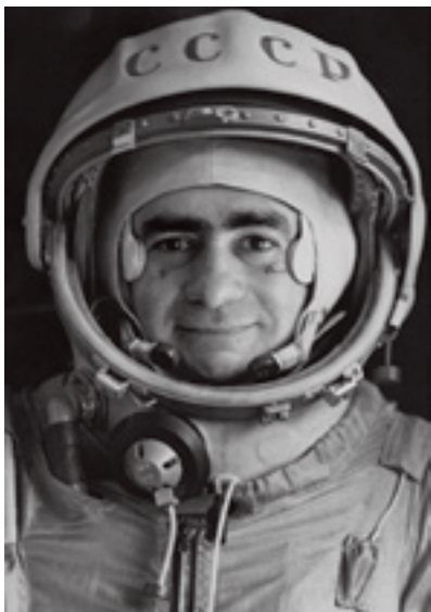
Joan Fontcuberta, Ivan Istochnikov de la série Sputnik, 1997.

Depuis le début des années 1970, John Fontcuberta (1955, Barcelone) travaille comme artiste visuel et photographe tout en poursuivant un large éventail d'activités dans les domaines de la critique, de la théorie, du commissariat d'expositions et de l'éducation. Au fil de projets comme Herbarium (1985), Fauna (1988), Sputnik (1997) et Deconstructing Osama (2007), il cerne le conflit entre nature, technologie et politique.