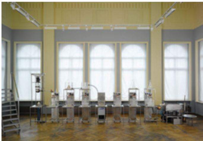
Wim Delvoye, Cloaca Original , 2000. Vue d'installation au Casino Luxembourg, 2007.