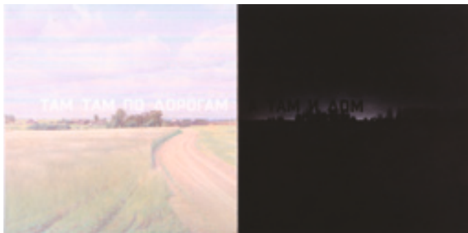
Erik Boulatov, Là-bas, là-bas sur les chemins, et là, la maison , 2002. Collection Musée d'Art Moderne Grand-Duc Jean, Mudam Luxembourg.

In the framework of the exhibition Go East II at Mudam Luxembourg (10/10/2009-03/01/2010).