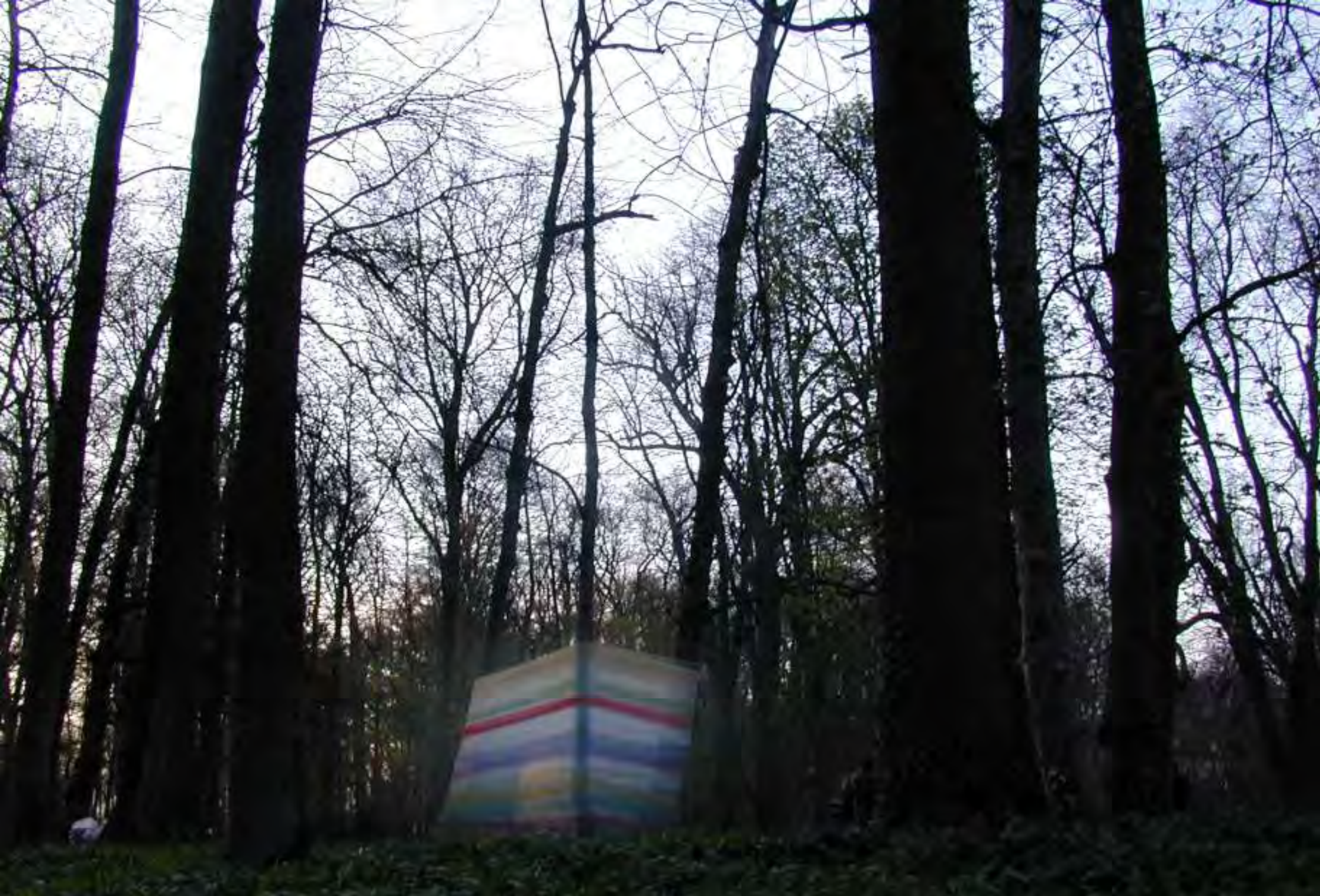
Recinto O2 - Parco del Castello di Racconigi (Cn), 04 aprile 2004 - Situazione dopo 9 ore e 3 min. di avvolgimento e circa 13 km a testa percorsi.