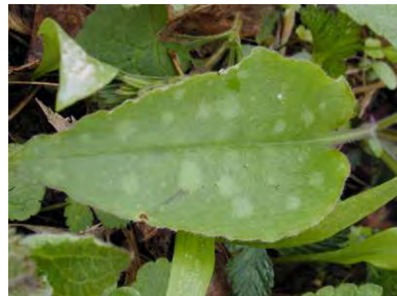
Recinto 02 - Parco del Castello di Racconigi (Cn), 04 aprile 2004 Pulmonaria officinalis : una delle specie identificate all'interno del recinto