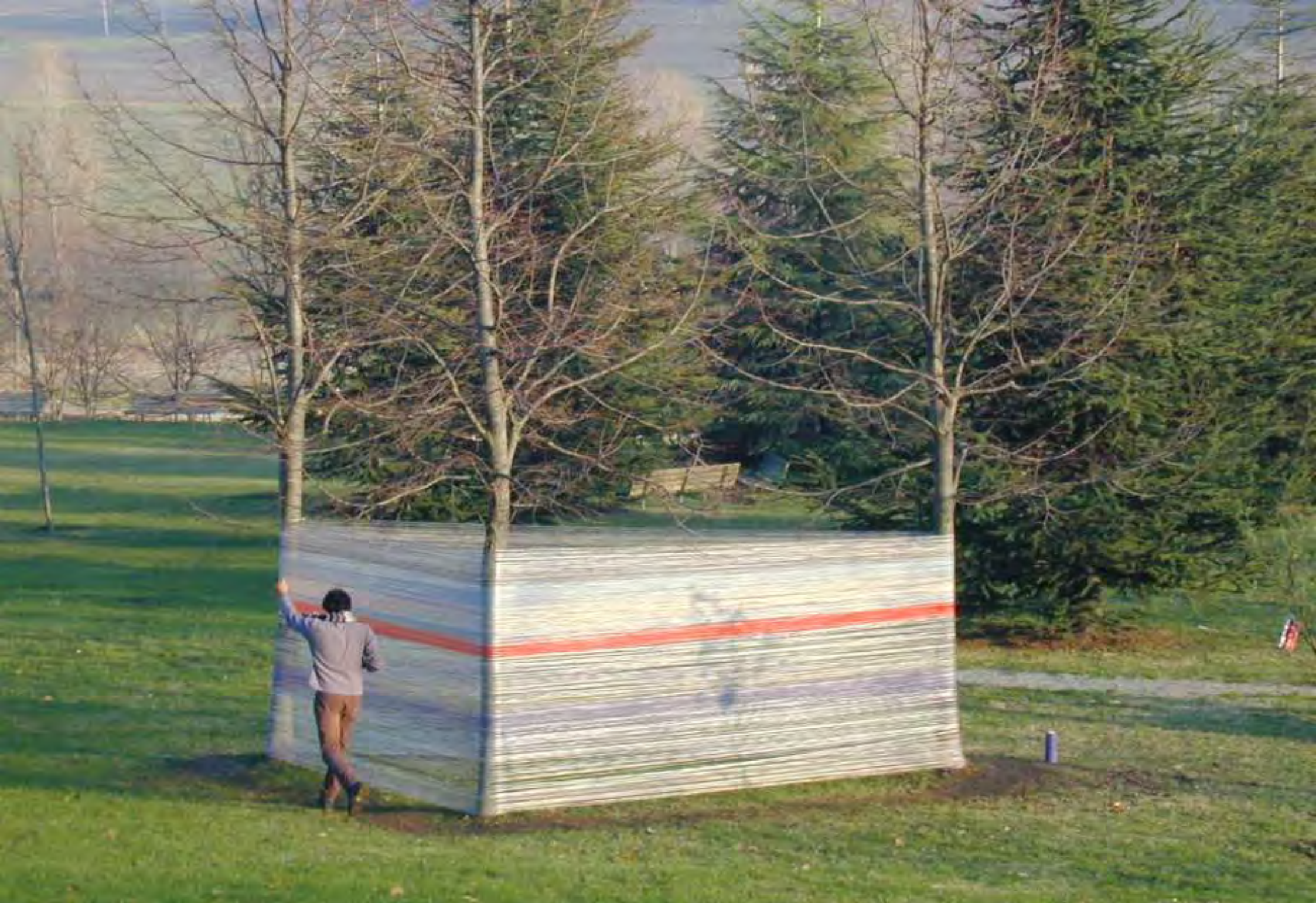
Recinto 01 - Parco Lungo Fiume - Città di Castel San Pietro Terme (BO), 14 dicembre 2003 - Situazione dopo 5 ore di avvolgimento.