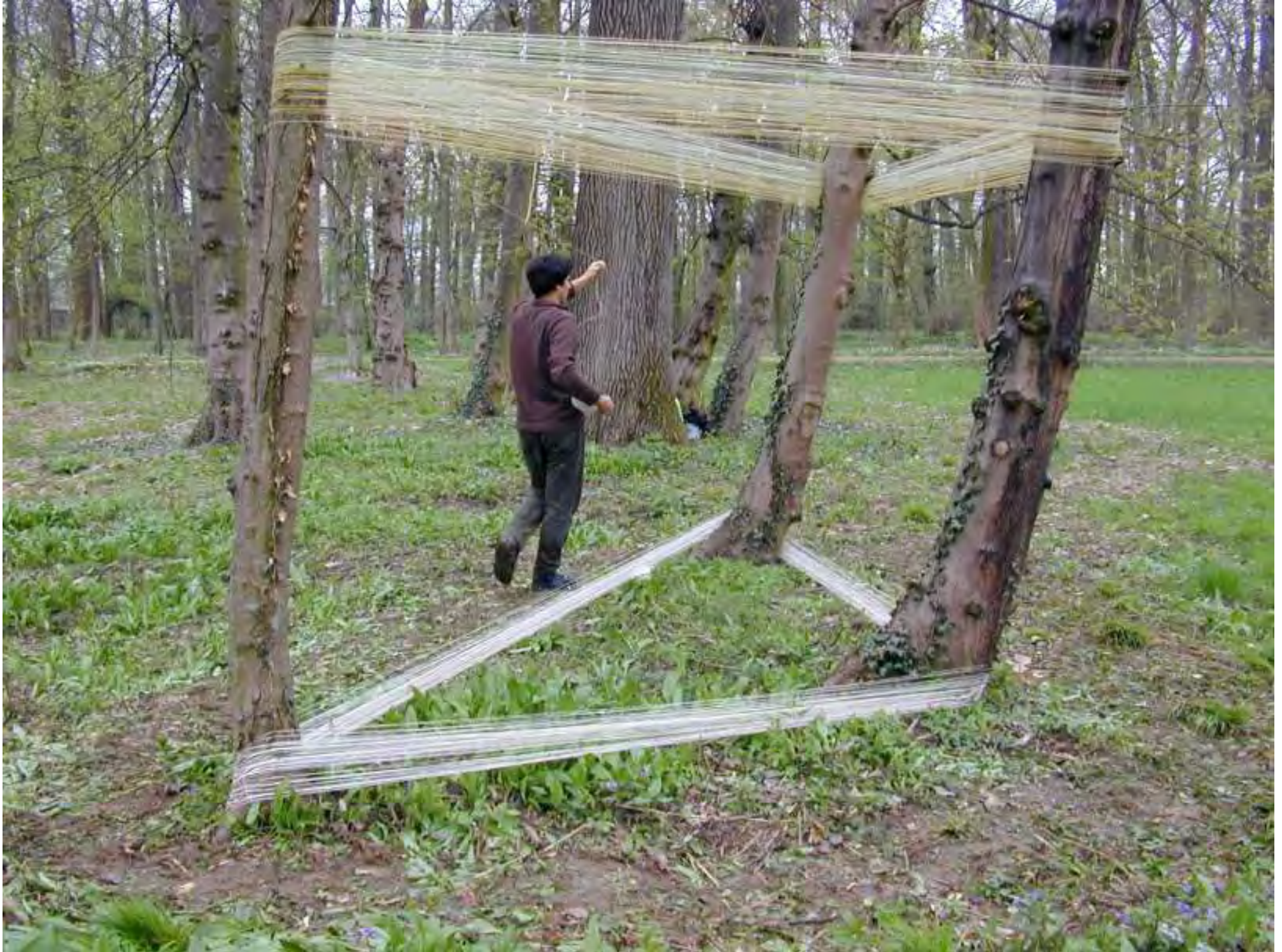
Recinto 02 - Parco del Castello di Racconigi (Cn), 04 aprile 2004 - Situazione dopo 36 minuti di avvolgimento