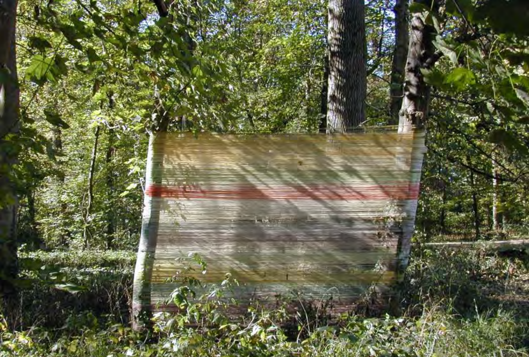
Recinto 02 - Parco del Castello di Racconigi (Cn); situazione al 17 ottobre 2004 (dopo 6 mesi e 13 giorni)