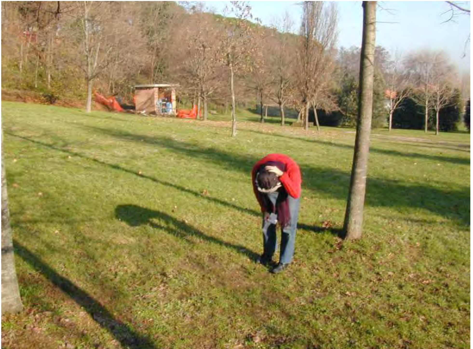
Recinto 01 - Parco Lungo Fiume, Città di Castel San Pietro Terme (BO), 14 dicembre 2003. Analisi degli elementi presenti nella zona che sarà recintata.