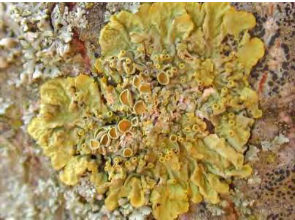
Recinto 01 - Parco Lungo Fiume - Città di Castel San Pietro Terme (BO), 14 dicembre 2003 Licheni del gen. Xanthoria , identificati all'interno del recinto