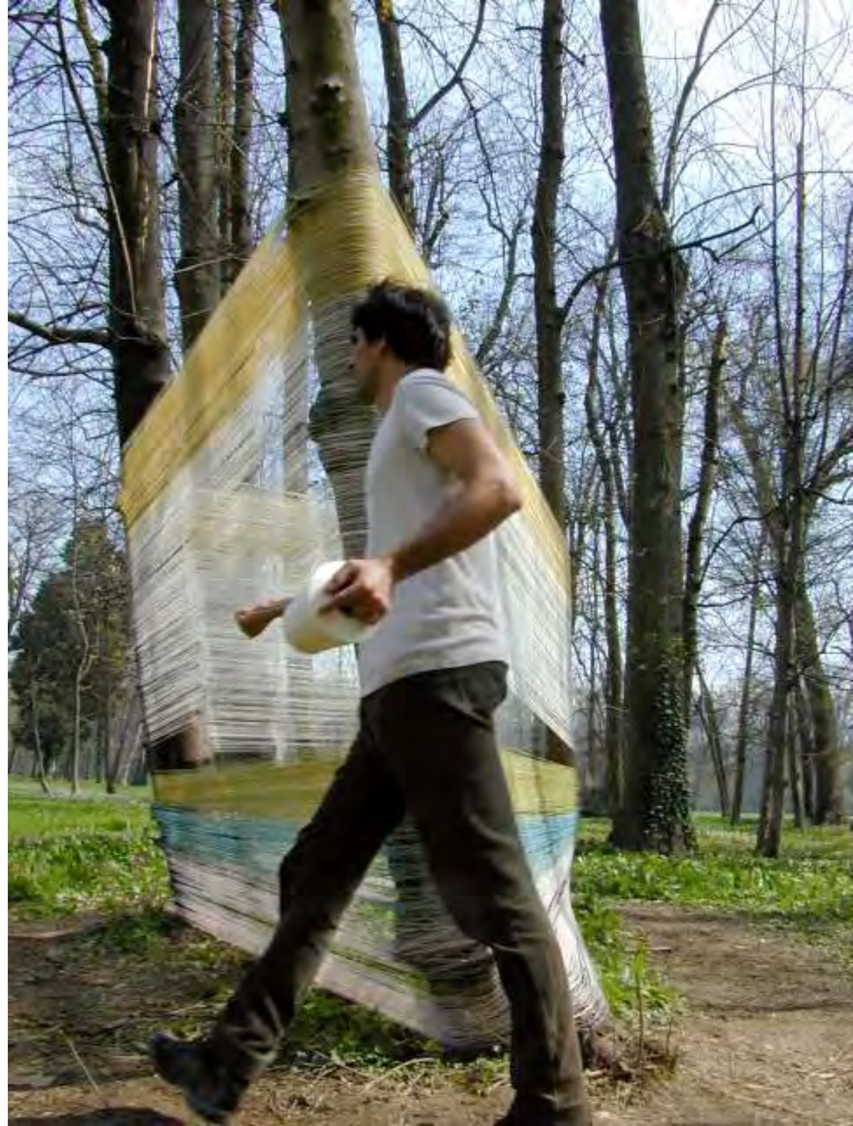
Recinto 02 - Parco del Castello di Racconigi (Cn), 04 aprile 2004 Situazione dopo 3 ore e 45 min. di avvolgimento