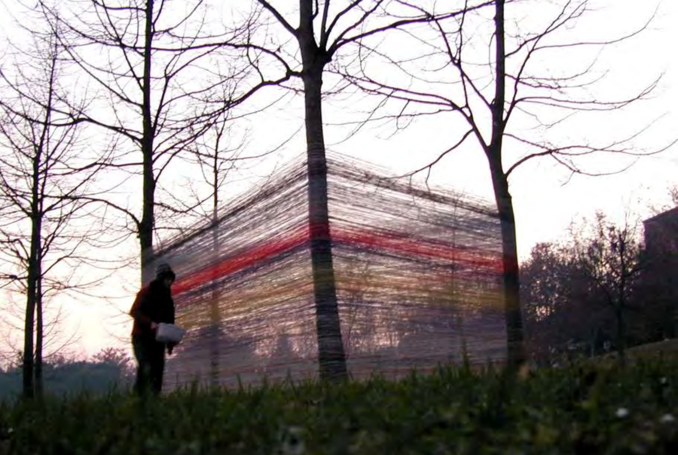
Recinto O1 - Parco Lungo Fiume - Città di Castel San Pietro Terme (BO), 14 dicembre 2003 - Situazione dopo 8 ore e 10 min. di avvolgimento e circa 14 km a testa percorsi.