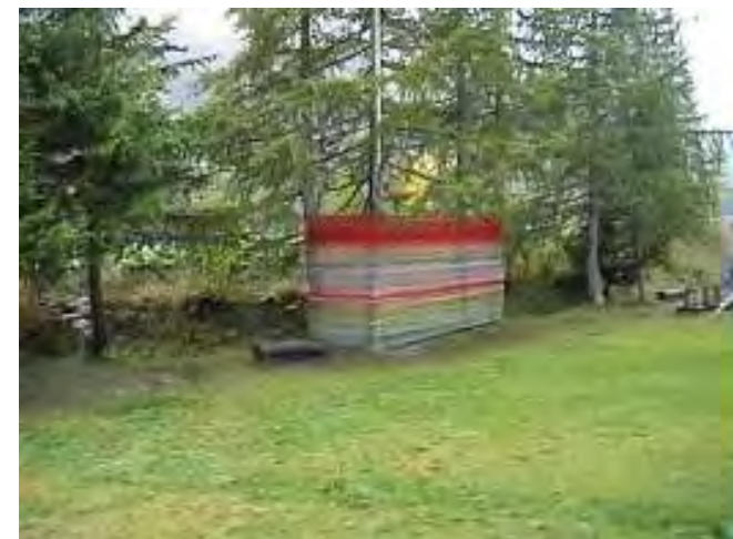
Recinto O3 - azione collettiva di recinzione di porzione di spazio. Realizzato in collaborazione con gli studenti del Corso di Formazione per Dottorandi organizzato dal Centro Interuniversitario IRIS - Istituto di Ricerche Interdisciplinari sulla Sostenibilità. Sant'anna di Bellino, Val Varaita, 17-19 settembre 2005