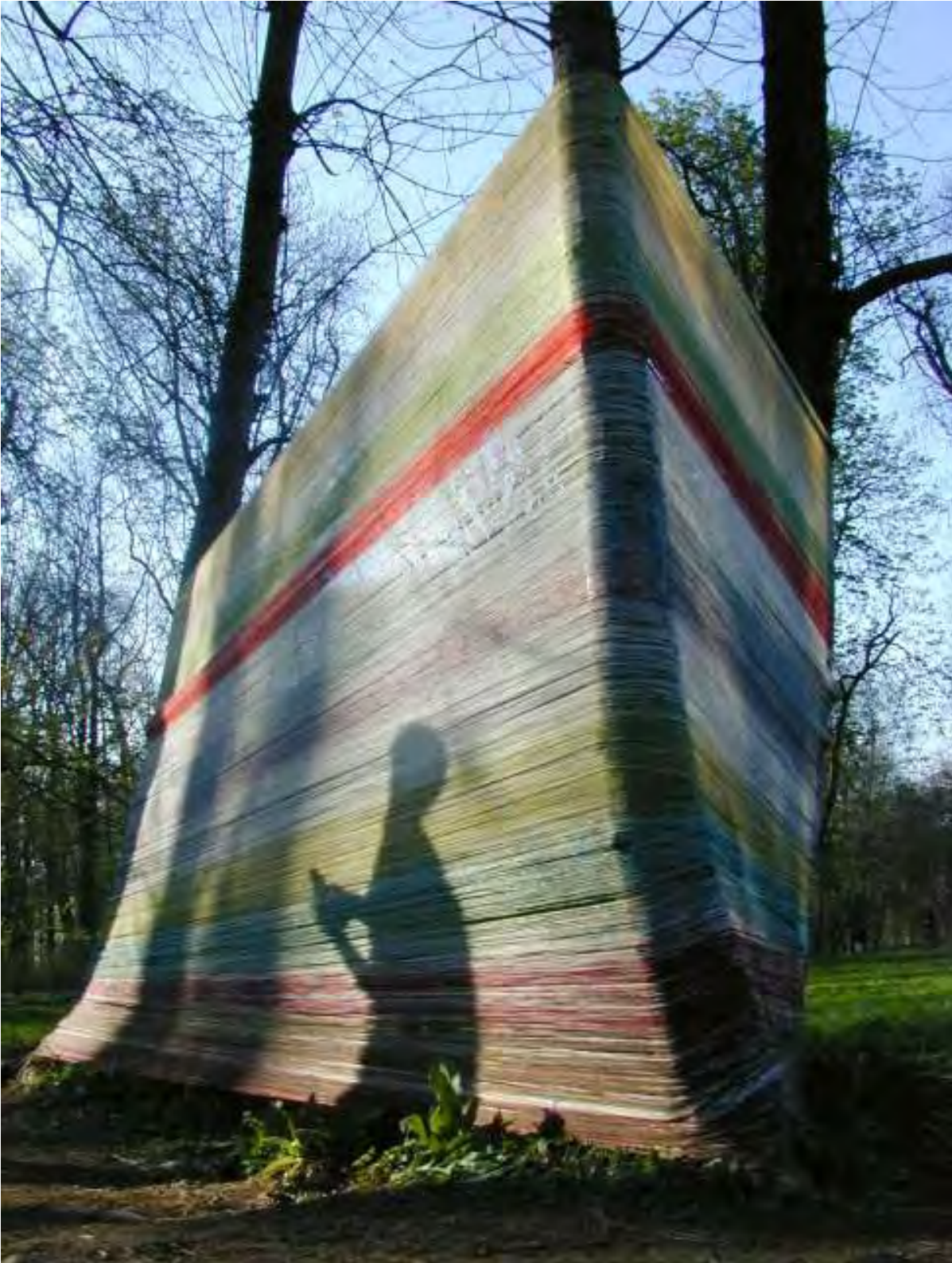
Recinto 02 - Parco del Castello di Racconigi (Cn), 04 aprile 2004 Situazione dopo 8 ore e 4 min. di avvolgimento