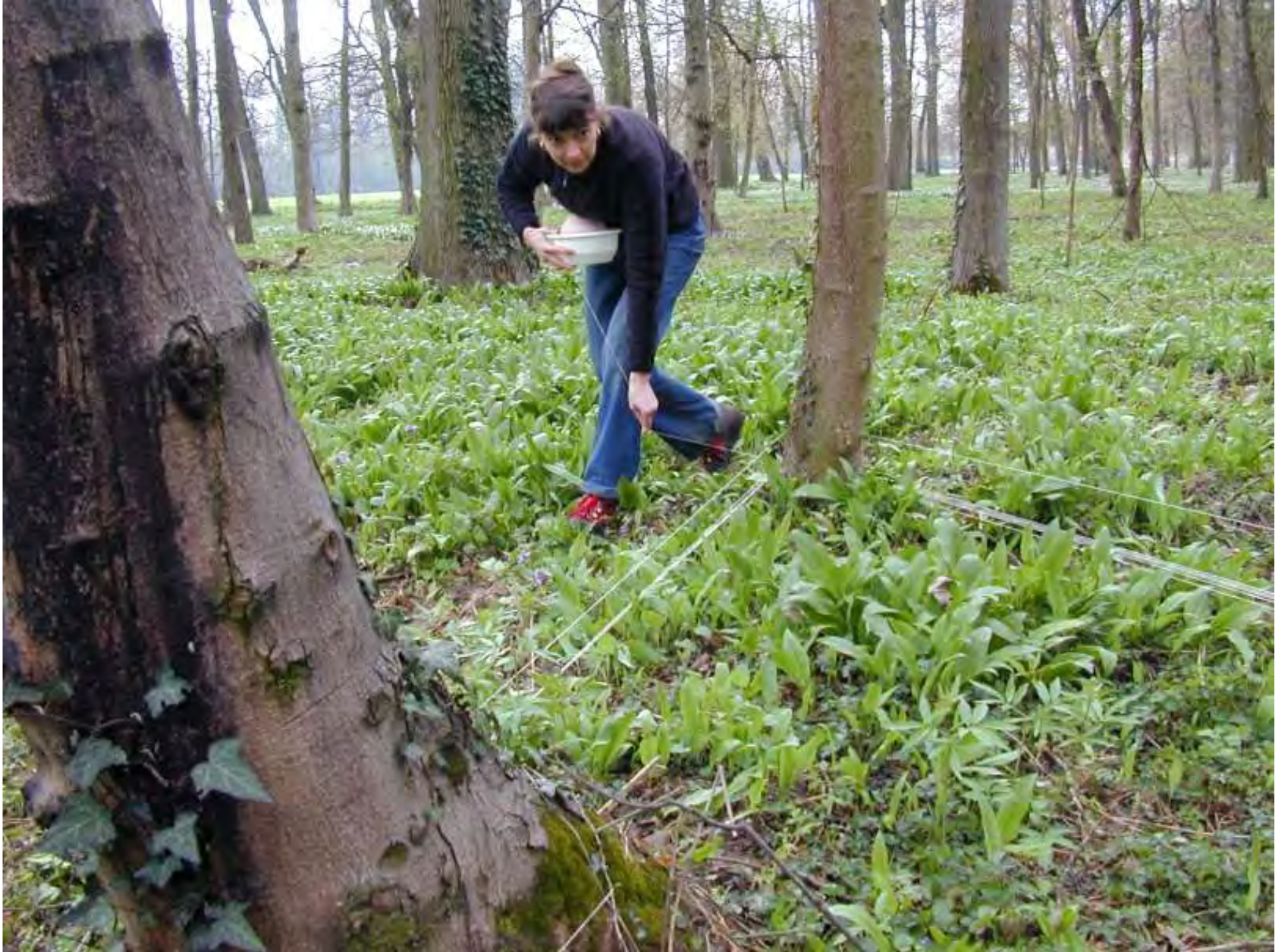
Recinto 02 - Parco del Castello di Racconigi (Cn), 04 aprile 2004 - Fasi iniziali dell'azione di recinzione.