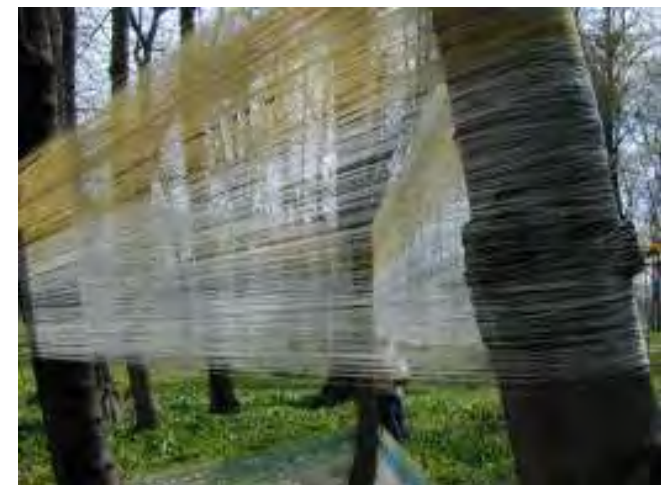
Recinto 02 - Parco del Castello di Racconigi (Cn), 04 aprile 2004 - Sequenze di lavoro: avvolgimento da 2 ore 48 min. a 2 ore 54 min.