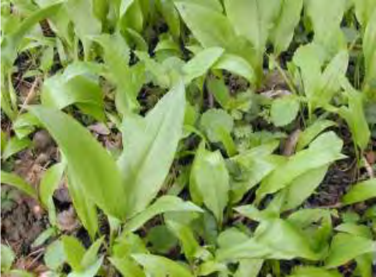
Recinto 02 - Parco del Castello di Racconigi (Cn), 04 aprile 2004 Allium ursinum : una delle specie identificate all'interno del recinto