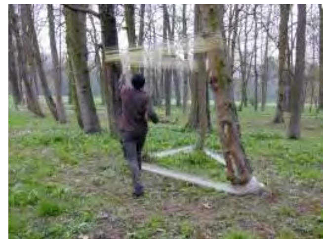
Recinto 02 - Parco del Castello di Racconigi (Cn), 04 aprile 2004 - Sequenze di lavoro: avvolgimento da 1 ore 34 min a 2 ore e 32 min.