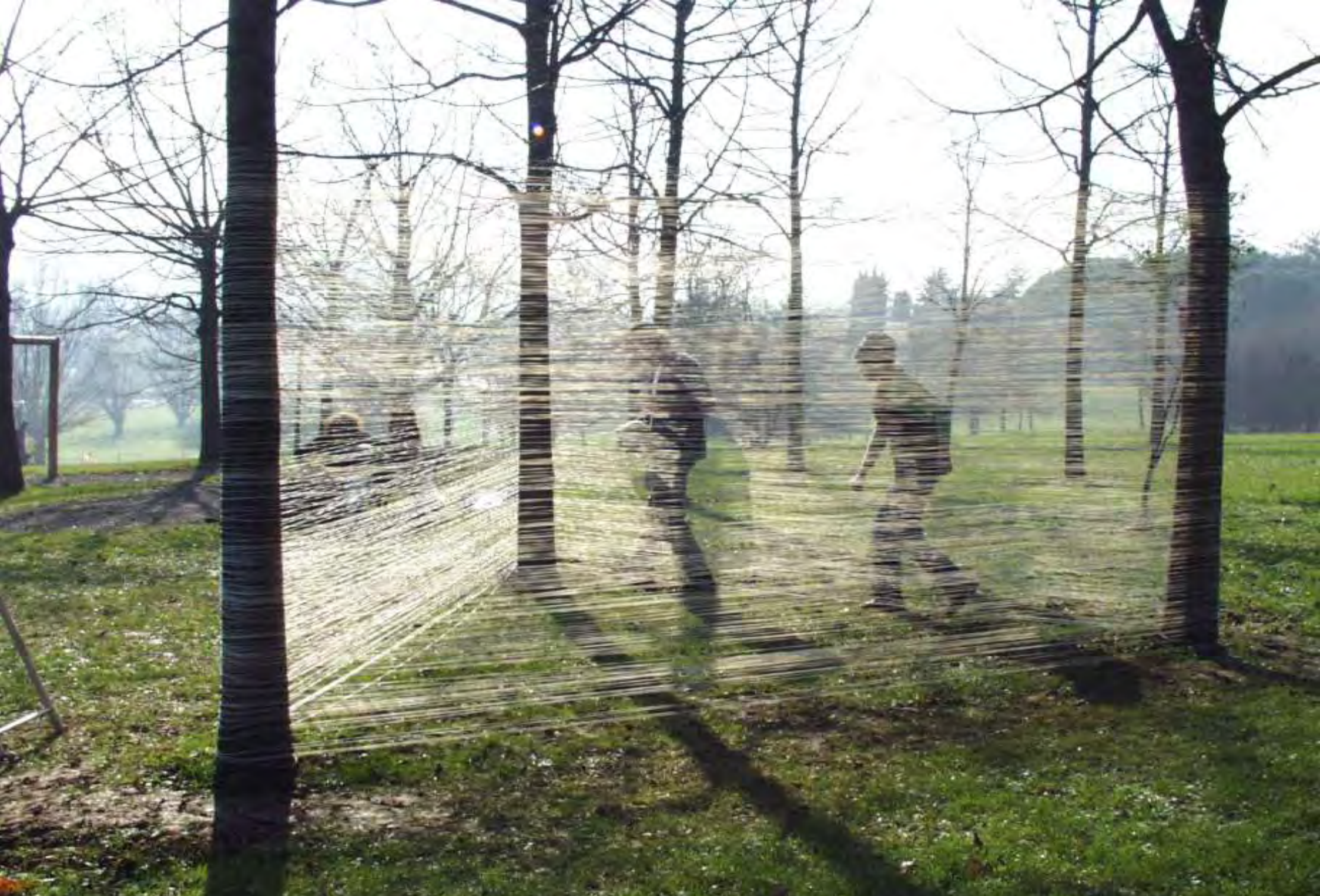
Recinto 01 - Parco Lungo Fiume, Città di Castel San Pietro Terme (BO), 14 dicembre 2003 - Situazione dopo 1 ora e 5 min. di avvolgimento