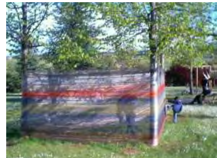
Recinto 01 - Parco Lungo Fiume - Città di Castel San Pietro Terme (BO) - Situazione dopo 4 mesi (aprile 2004).