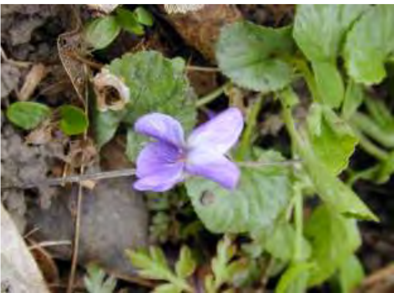
Recinto 02 - Parco del Castello di Racconigi (Cn), 04 aprile 2004 Viola odorata : una delle specie identificate all'interno del recinto