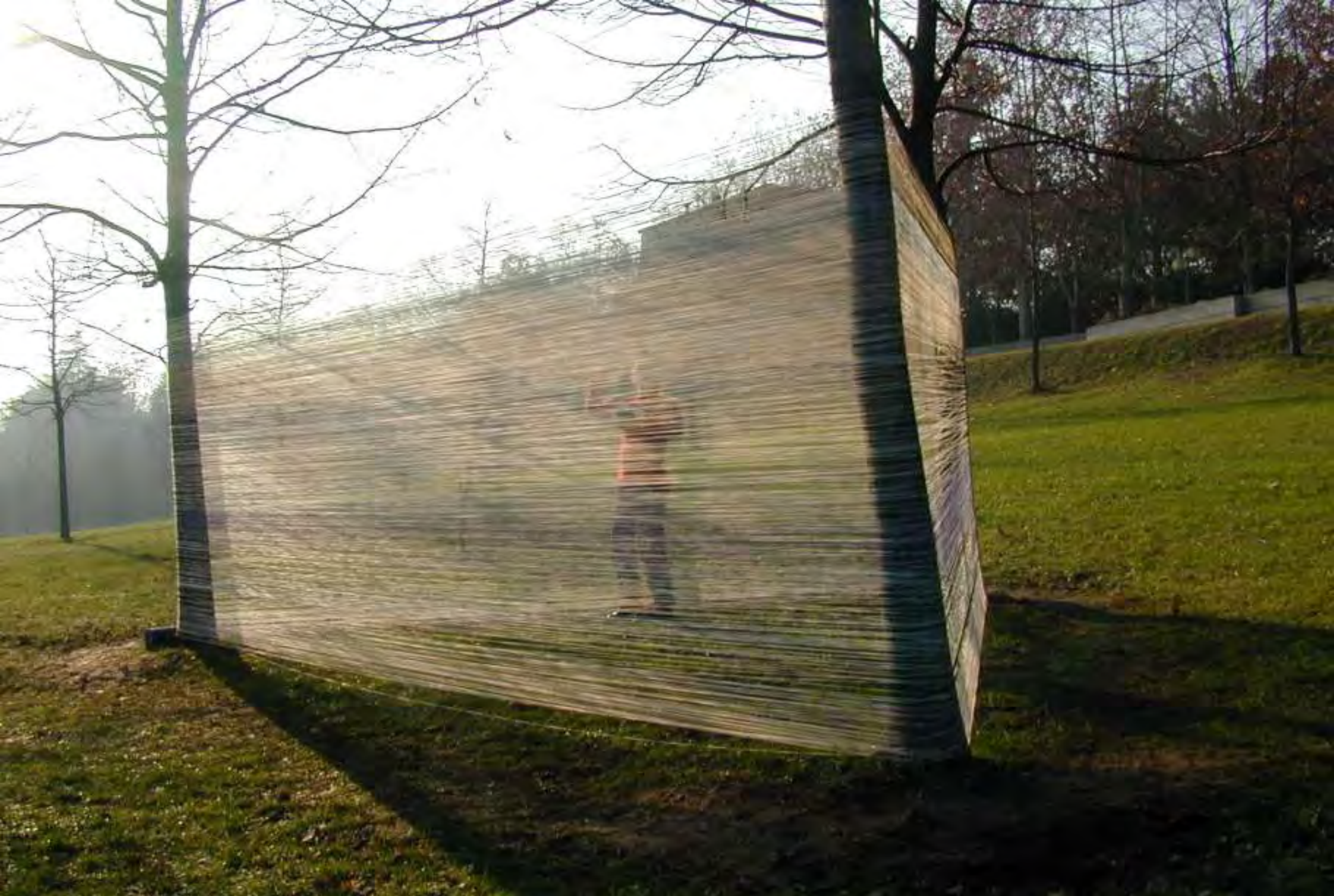
Recinto 01 - Parco Lungo Fiume, Città di Castel San Pietro Terme (BO), 14 dicembre 2003 - Situazione dopo 4 ore e 50 min. di avvolgimento