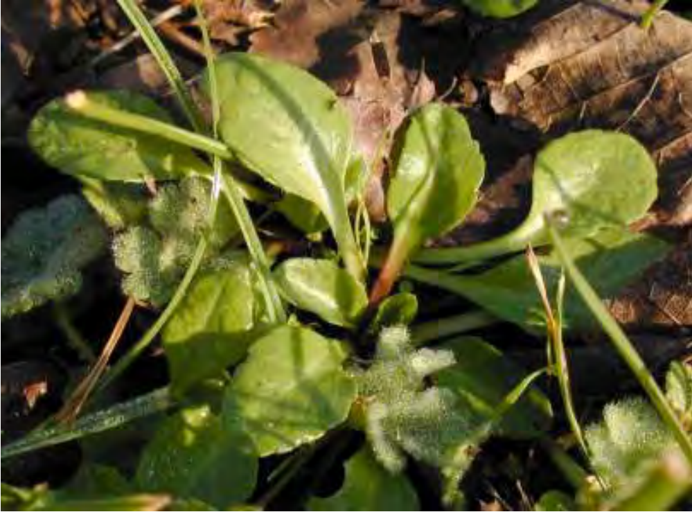
Recinto 01 - Parco Lungo Fiume - Città di Castel San Pietro Terme (BO), 14 dicembre 2003 Bellis perennis : una delle specie identificate all'interno del recinto