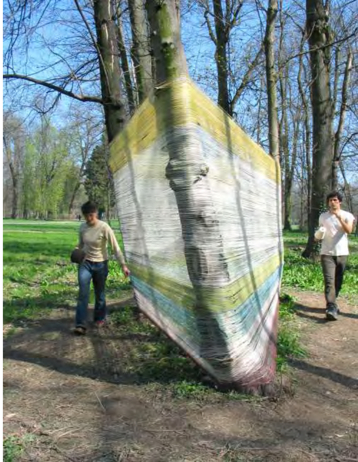
Recinto 02 - Parco del Castello di Racconigi (Cn), 04 aprile 2004 Situazione dopo 3 ore e 45 min. di avvolgimento