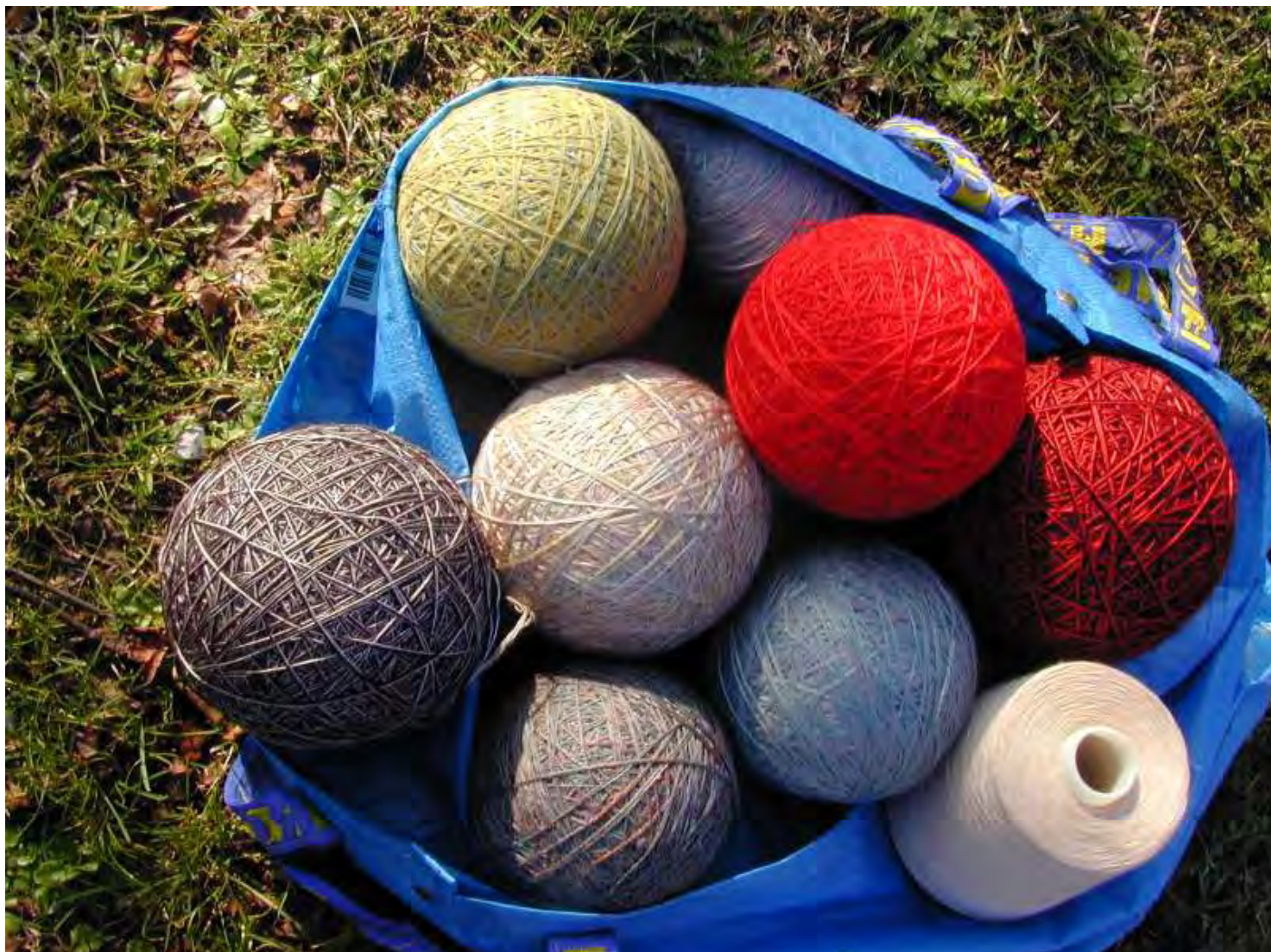
filati utilizzati per la realizzazione del recinto