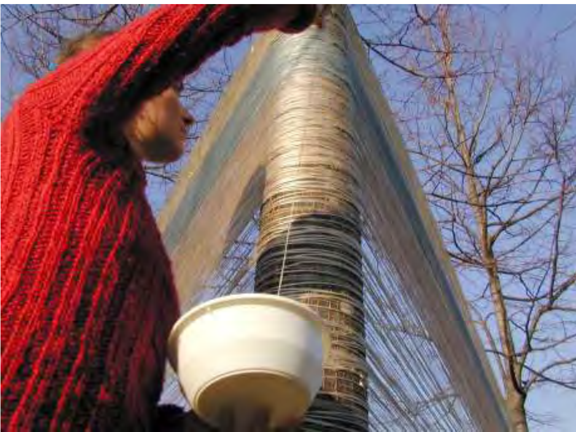
Recinto 01 - Parco Lungo Fiume, Città di Castel San Pietro Terme (BO) - 14 dicembre 2003 Situazione dopo 4 ore di avvolgimento