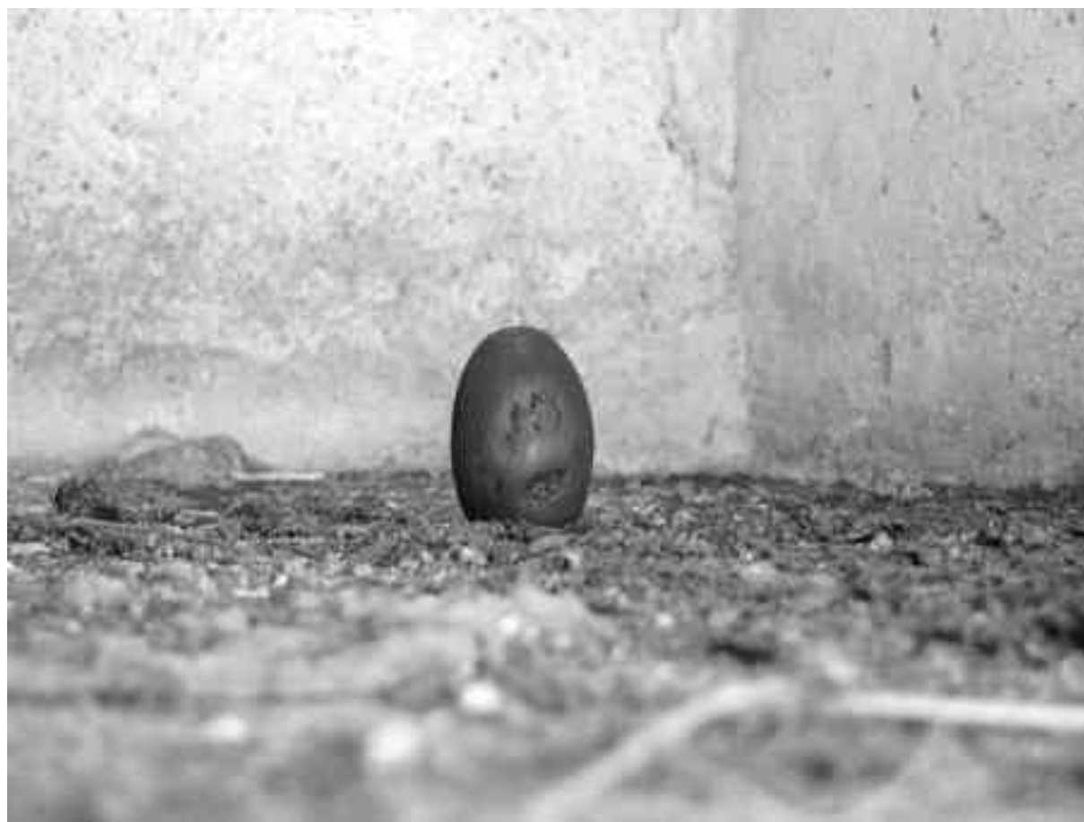
3. GALLI NA NERA FA L'UOVO BI ANCO / BLACK HEN LAYS WHITE EGG Antracite di Plaisance, luce / "anthracite" coal from « Plaisance », light