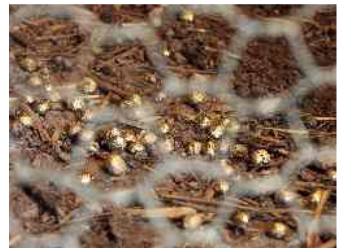
4. TUTTO CIO' CHE LUCCICA E' ORO / EVERYTHING THAT SHINES IS GOLD sterco di coniglio, vernice dorata, luce / rabbit poop, gilding, light