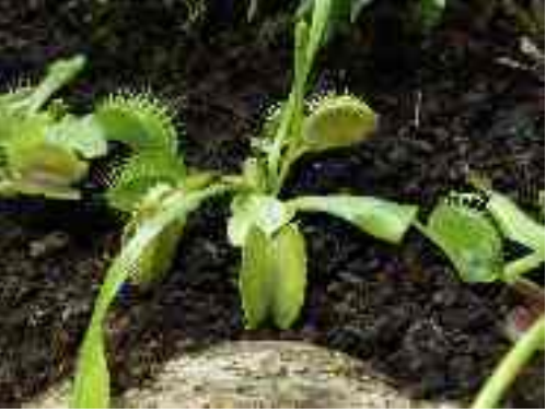
carnivorous gen. Dionaea