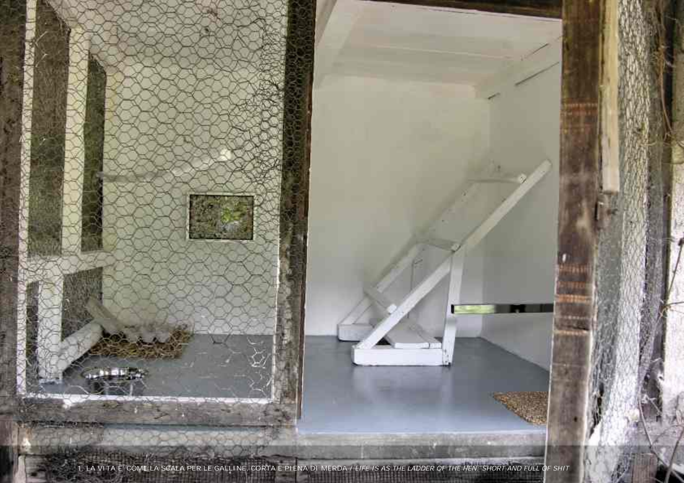
1. LA VITA E' COME LA SCALA PER LE GALLINE, CORTA E PIENA DI MERDA / LIFE IS AS THE LADDER OF THE HEN: SHORT AND FULL OF SHIT