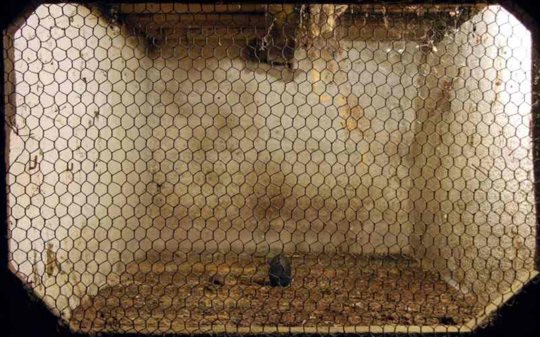
3. GALLINA NERA FA L'UOVO BIANCO / BLACK HEN LAYS WHITE EGG