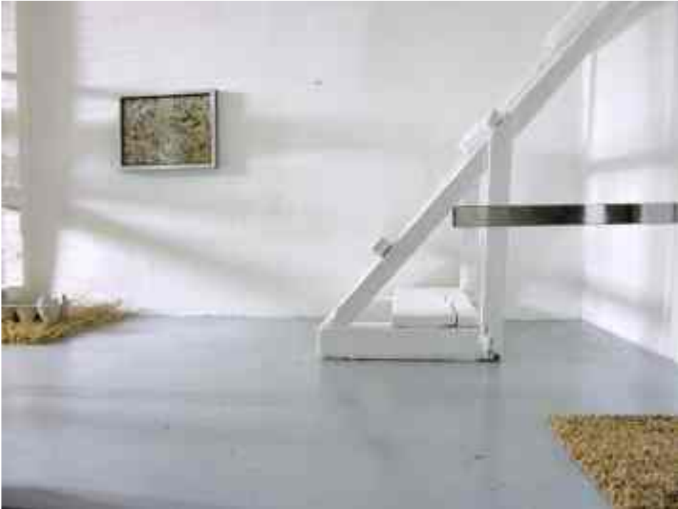
1. LA VITA E' COME LA SCALA PER LE GALLINE, CORTA E PIENA DI MERDA LIFE IS AS THE LADDER OF THE HEN: SHORT AND FULL OF SHIT

Stucco, smalto, acrilico bianco, scala per galline, riproduzione di un quadro di J. Pollock, grano, contenitore per uova, paglia, elementi in acciaio Coating, white paint, ladder for hen, reproduction of a J. Pollock's painting, stick for hen, elements in steel