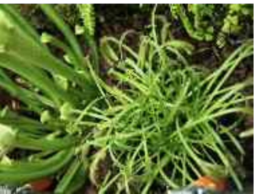
carnivorous gen. Drosera