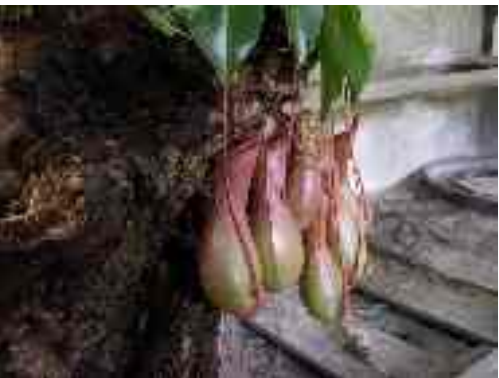
carnivorous gen. Nepenthes