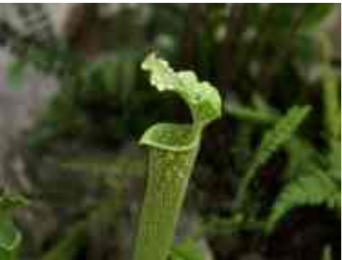
carnivorous gen. Sarracenia