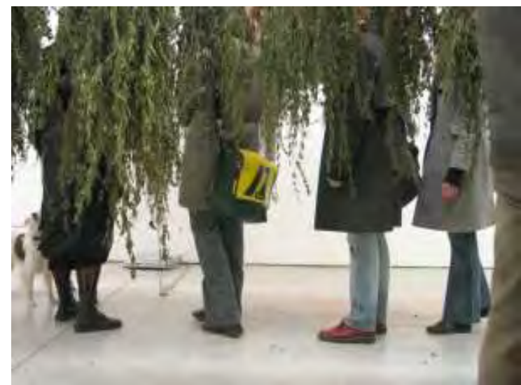
FIBRAE_ Urtica dioica - azione di raccolta e trasformazione di piante selvatiche da fibra Installazione per la mostra Io & Te c/o Via Farini, Milano (a cura di Barbara Fässler e Paolo Bianchi); novembre / dicembre 2005. Mazzi di ortiche in fase di essiccazione, dvd su monitor lcd 8".