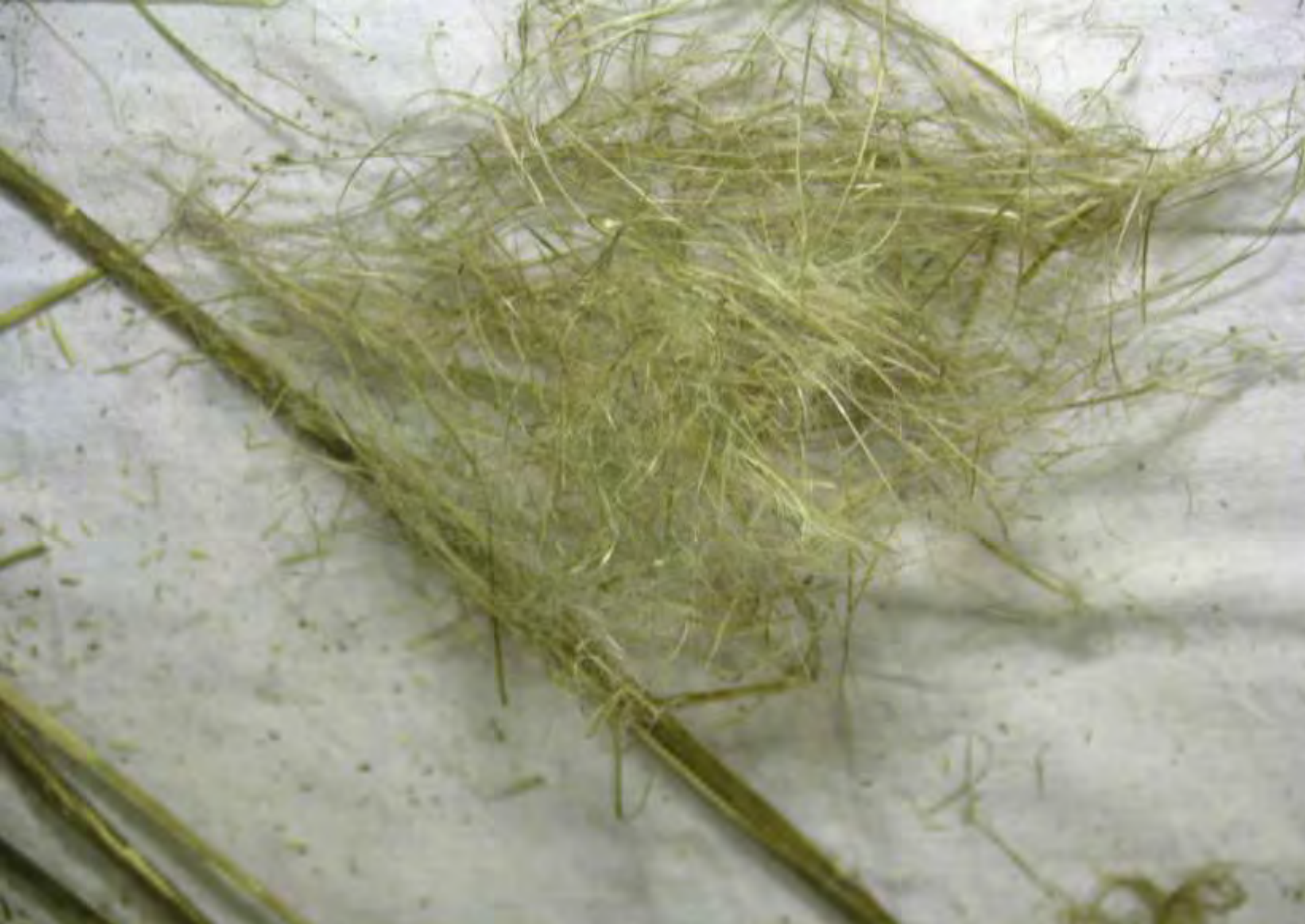
FIBRAE_ Urtica dioica - azione di raccolta e trasformazione di piante selvatiche da fibra Operazione di stigliatura , separazione delle fibre dagli steli di Urtica dioica macerati e essiccati - Torino; novembre 2005.

FIBRAE_ Urtica dioica – action of harvesting and transforming of wild fibers plants swingling Urtica dioica stems, after retting and drying up, Turin; november 2005