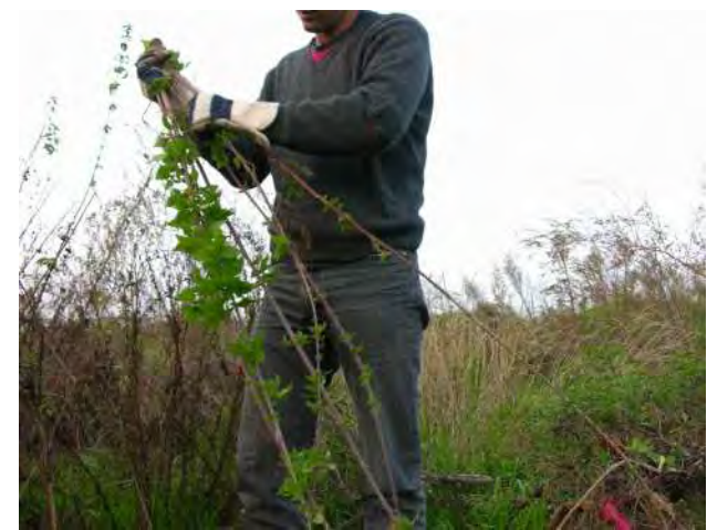
FIBRAE_ Urtica dioica - azione di raccolta e trasformazione di piante selvatiche da fibra Raccolta degli steli - Moncalieri, zona Tangenziale pressi uscita San Paolo; novembre 2005.