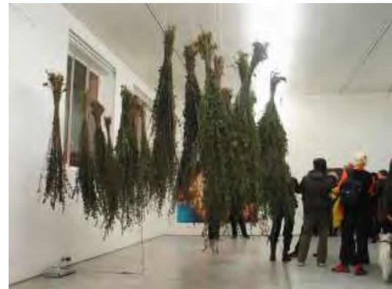
FIBRAE_ Urtica dioica - azione di raccolta e trasformazione di piante selvatiche da fibra Installazione per la mostra Io & Te c/o Via Farini, Milano (a cura di Barbara Fässler e Paolo Bianchi); novembre / dicembre 2005. Mazzi di ortiche in fase di essiccazione, dvd su monitor lcd 8"