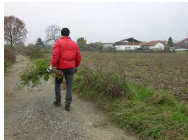
FIBRAE_ Urtica dioica - azione di raccolta e trasformazione di piante selvatiche da fibra Raccolta degli steli - Moncalieri, zona Tangenziale pressi uscita San Paolo; novembre 2005.