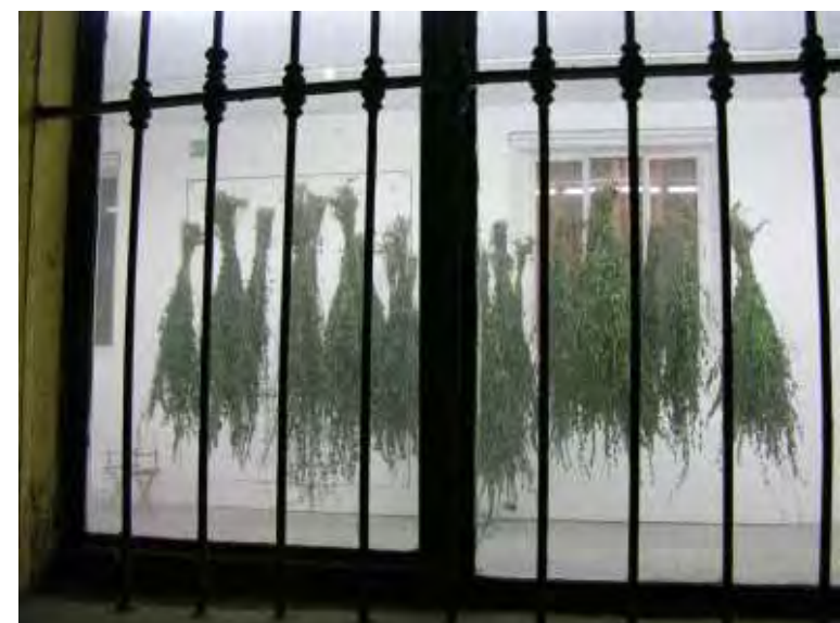
FIBRAE_ Urtica dioica - azione di raccolta e trasformazione di piante selvatiche da fibra Installazione per la mostra Io & Te c/o Via Farini, Milano (a cura di Barbara Fässler e Paolo Bianchi); novembre / dicembre 2005. Mazzi di ortiche in fase di essiccazione, dvd su monitor lcd 8".