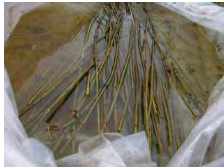
FIBRAE_ Urtica dioica - azione di raccolta e trasformazione di piante selvatiche da fibra Macerazione degli steli in acqua - Moncalieri, fraz. Revigliasco; novembre 2005.