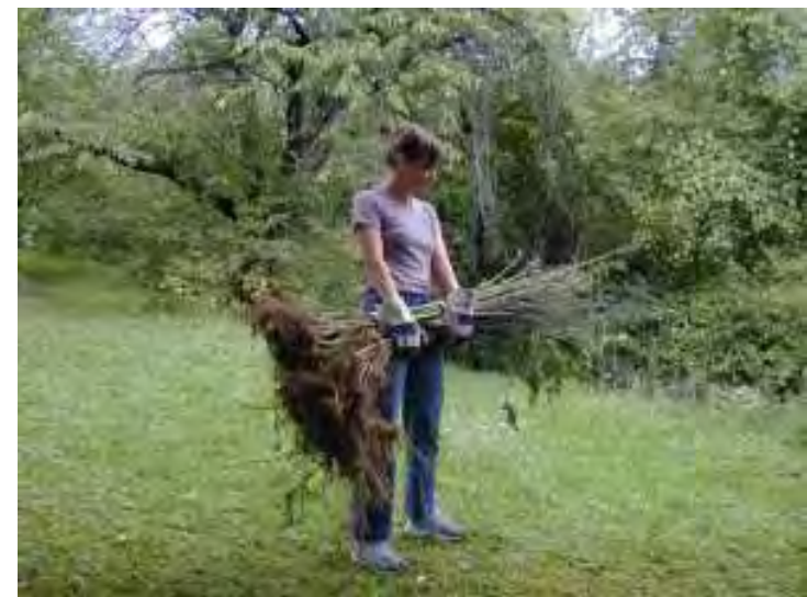
FIBRAE_ Urtica dioica - azione di raccolta e trasformazione di piante selvatiche da fibra Pulizia e trasporto degli steli essiccati - Moncalieri, fraz. Revigliasco; agosto/settembre 2005