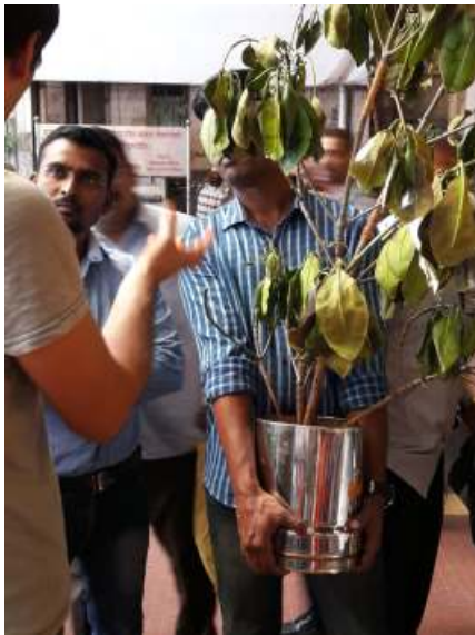
Giovane pianta di Mangrovia, Thane Creek, Mumbai; portavaso di acciaio; pigmento arancione