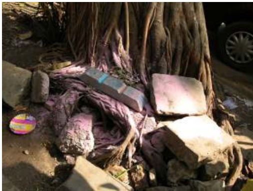
Lingotto di alluminio riciclato proveniente dallo slum di Dharavi, pigmento verde e rosa. Isola-Tempio > Mazagaon