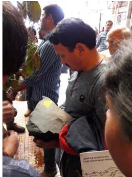
Blocco di Basalto, Gilbert Hill, Andheri Est, Mumbai; pigmento giallo