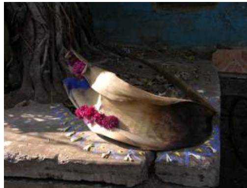
Foglia di palma raccolta a Andheri West, Mumbai; pigmento blu. Isola-Tempio > Old Woman's Island