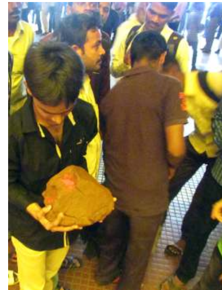
Terra argillosa rossa, Vile Parle, Mumbai; pigmento rosso