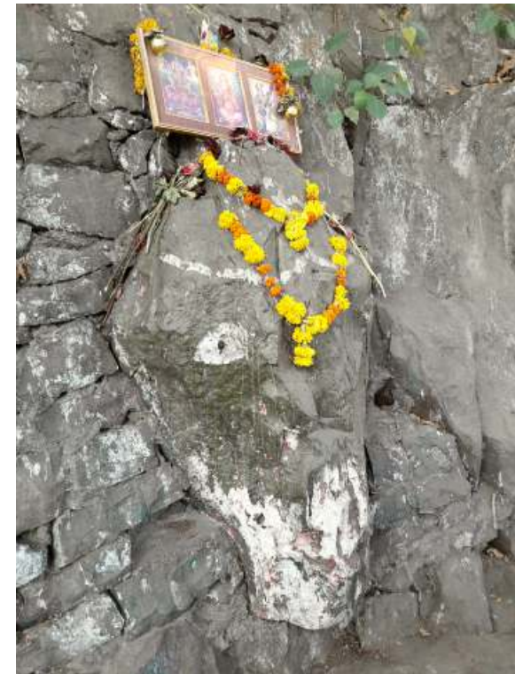
Roccia zoomorfa in muro di pietre su strada, trasformata dagli abitanti in piccolo Tempio. Mumbai, Novembre 2016