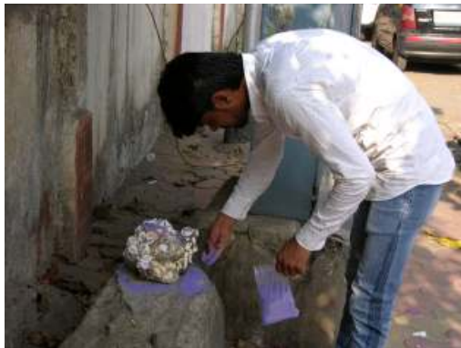
☒ Cement Island Temple , Colaba Island Mumbai, 4 Dicembre 2016

Le sette "Isole-Tempio" sono state restituite al paesaggio della città di Mumbai attraverso la performance conclusiva "Seven Islands Temple_The Procession". Un minuzioso lavoro di ricostruzione geografica del perimetro delle antiche isole ci ha permesso di individuare sette punti nei quali, coadiuvati da un gruppo formato dai giovani performer e altre persone interessate, abbiamo allestito i sette templi, presidi a protezione del ricordo dell'antico paesaggio scomparso.