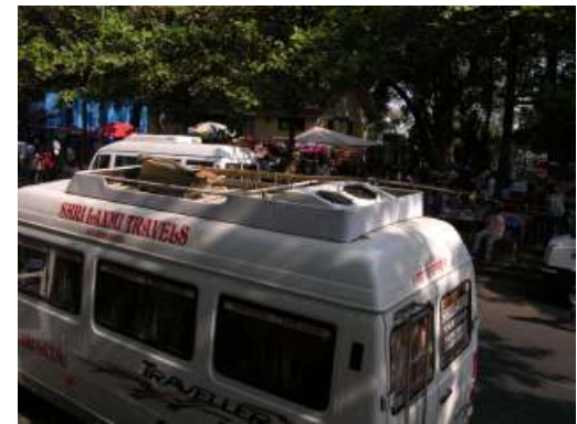
Performance itinerante con minibus: Parel / Mahim / Worli / Mazgaon / Girgaum Chowpatty / Cuffe Parade / Colaba